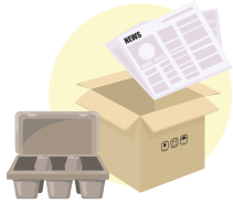
کاغذ و مقوا