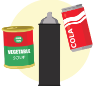
قوطی، آئروسول و فویل آلومینیومی