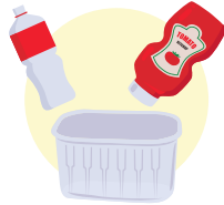
پلاستیکی سفت و سخت بطری ها و ظروف