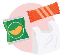
زباله های معمولی و کیسه های پلاستیکی