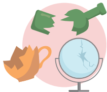
شیشه شکسته، ظروف و آینه