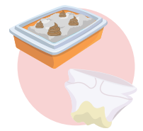
Pannolini ed escrementi di animali domestici