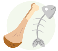
Pesce e carne