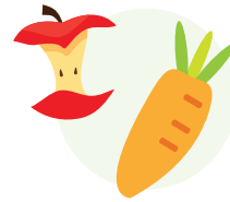
Frutta e verdura