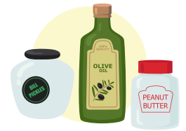
Bottiglie e barattoli di vetro