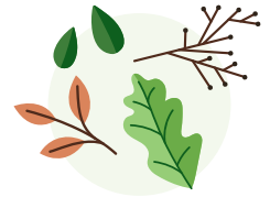
Giardino: foglie e sfalci da giardino, erbacce ed erba tagliata, piccoli rami e ramoscelli.