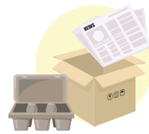
Carta e cartone