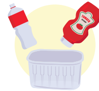
Bottiglie e contenitori in plastica rigida