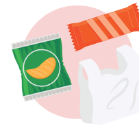
Rifiuti generici e sacchetti di plastica