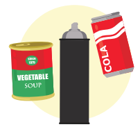
Lattine, contenitori spray e carta stagnola