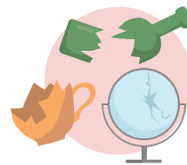
Vetri rotti, stoviglie e specchi