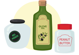
काँचका बोटल र जारहरू