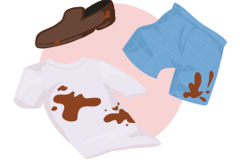
दान दिन नमिल्ने लुगा र खेलौनाहरू