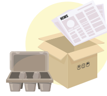
कागज र गत्ता

कुनै झोलाहरू नफाल्नुहोस् वा झोलामा रहेको वस्तुहरू नफाल्नुहोस्