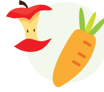
फलफूल र तरकारीहरू