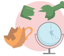
फुटेको गिलास, भाँडाकुडा र ऐना