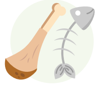
समुद्री खाना र मासु