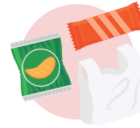
सामान्य फोहोर र प्लास्टिकका झोला