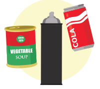
क्यान, एरोसोल र एल्युमिनियम फोइल