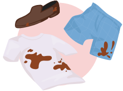
وہ کپڑے اور کھلونے جو عطیے میں نہ دیے جا سکتے ہوں