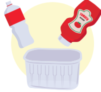
سخت پلاسٹک کی بوتلیں اور کنٹینرز