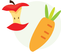
پھل اور سبزیاں