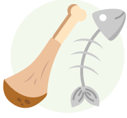
سمندری غذائیں اور گوشت