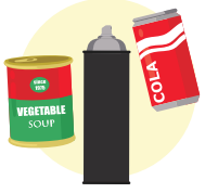
کینز، ایروسول کینز اور المونیم فوائل

✗ کوئی تھیلے یا تھیلے میں بند چیزیں نہ ہوں