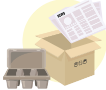
کاغذ اور گتا