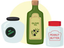
شیشے کی بوتلیں اور جار