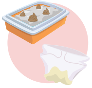
نیپیز اور پالتو جانوروں کا فضلہ