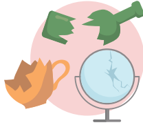
ٹوٹا ہوا شیشہ، برتن اور آئینے